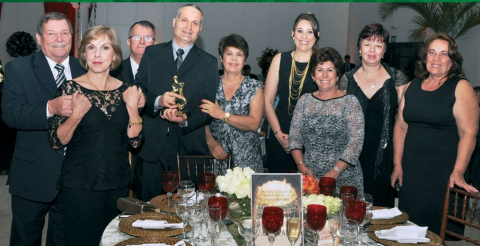
Equipe Ambicamp na Noite da Indústria