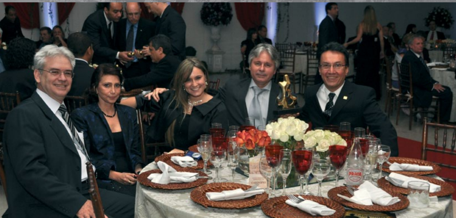
Equipe HI Tecnologia na Noite da Indústria

A HI Tecnologia foi a grande vencedora na categoria Melhor Empresa Micro/Pequena. Empresa brasileira de base tecnológica que opera desde 1989, atende a todo mercado nacional. Atua nas áreas de projeto e fabricação de equipamentos, desenvolvimento e implementação de softwares para supervisórios e integração de sistemas para automação industrial. Sua base de clientes é bastante ampla, englobando diversos setores de mercado, entre os quais destacam-se petróleo e gás, química e farmacêutica, têxtil, agrobusiness, autopeças e automobilística, indústria de base e bens de capital, ensino e pesquisa. Toda a tecnologia utilizada no desenvolvimento de seus produtos, seja hardware ou software, é própria. Mantém sistematicamente programas de parcerias com universidades e centros de pesquisas, com os quais está sempre desenvolvendo novos produtos e soluções para o mercado de automação. Possui desde o ano de 2004 o Certificado de Registro e Classificação Cadastral (CRCC) da Petrobras para fornecimento de controladores lógicos programáveis (CLP), painéis eletrônicos e sensores. É um dos principais fornecedores nacionais de soluções para controle e super-