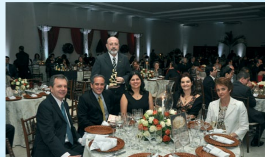
Equipe do Cristália recebeu premiação em nome de seu presidente.

mentos de uso psiquiátrico e hoje é o maior produtor de anestésicos e adjuvantes (produtos essencialmente hospitalares) em toda a América Latina, atendendo a mais de quatro mil estabelecimentos hospitalares.