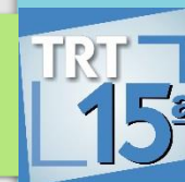
ÍNDICES DE ATUALIZAÇÃO